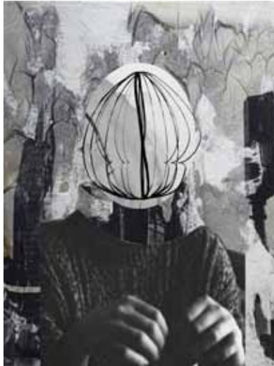
The eye & the finger, 2015 B/W darkroom print 30 x 40 Edition of 10 24 x 30 Edition of 30 + 10 AP (solarised)